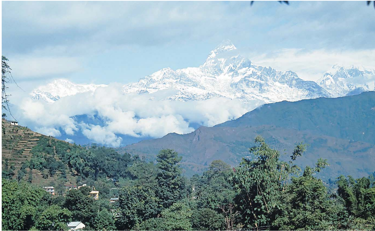
In Zentral-Nepal liegt das Annapurna-Gebirge. Die Region gehört mit ihren Seen, Tälern, Hochebenen und Bergen zu den schönsten Gebieten im Himalaya. Die Höchste Erhebung ist die Annapurna, mit einer Höhe von 8091 Metern der zehntgrößte Berg der Welt. Die Einheimischen haben den Berg der Göttin der Ernte gewidmet.

Vom Wohlstand vergangener Tage zeugen die Dörfer im höher gelegenen Kali Gandhaki Tal, als noch der Salzhandel mit Tibet blühte. Mit alten Salzwegen und Pilgerpfaden zum Heiligum Muktinath ist die Region auch für Trekker und Bergwan-